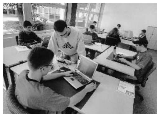
Für etliche Berufe musst du einen Eignungscheck machen.

Viele Lehrbetriebe verlangen bei der Lehrlingsauswahl Eignungstests oder Eignungsabklärungen. Wann soll welcher Test wie und wo gemacht werden, und worüber gibt das Testresultat Auskunft?