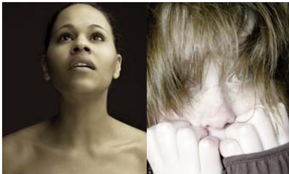
Wie würden Ihre Schülerinnen und Schüler Hoffnung, Treue, Trauer, Angst darstellen? Eine kleine Fotoausstellung macht den Jugendlichen bewusst, wie sie wirken.

Die Jugendlichen gestalten ein Plakat zu einer bestimmten Emotion (Nervosität, Trauer, Sehnsucht, Freude, Desinteresse, Anspannung usw.). Sie suchen im Internet nach Bildern (zB. www.fotocommunity.de/pc/pc/cat/2153 ) oder in der Schulbibliothek nach entsprechender Literatur. Danach versuchen die Jugendlichen mit ihren eigenen Mitteln (Fotohandy, Digitalkamera), die gewählte Emotion zu gestalten. Die Fotos sind Teil des Plakates, für das sie auch kleine Texte erstellen, in denen sie die körpersprachlichen Merkmale (Mimik, Gestik, Körperhaltung) der Emotion beschreiben. Wikipedia oder einschlägige Lexika helfen ihnen dabei.