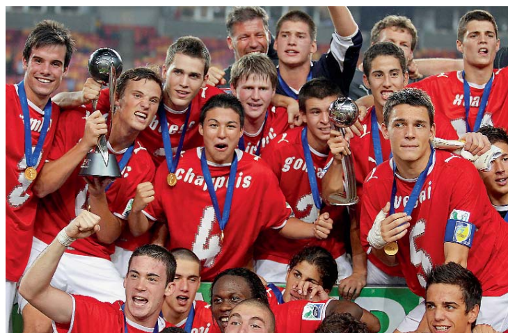
Die erfolgreichen Fussballer der U-17 Nationalmannschaft. Machen die eigentlich auch eine Lehre?