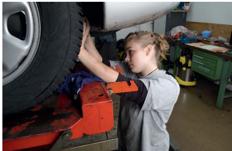
Autos und Motoren – keine reine Männerwelt.