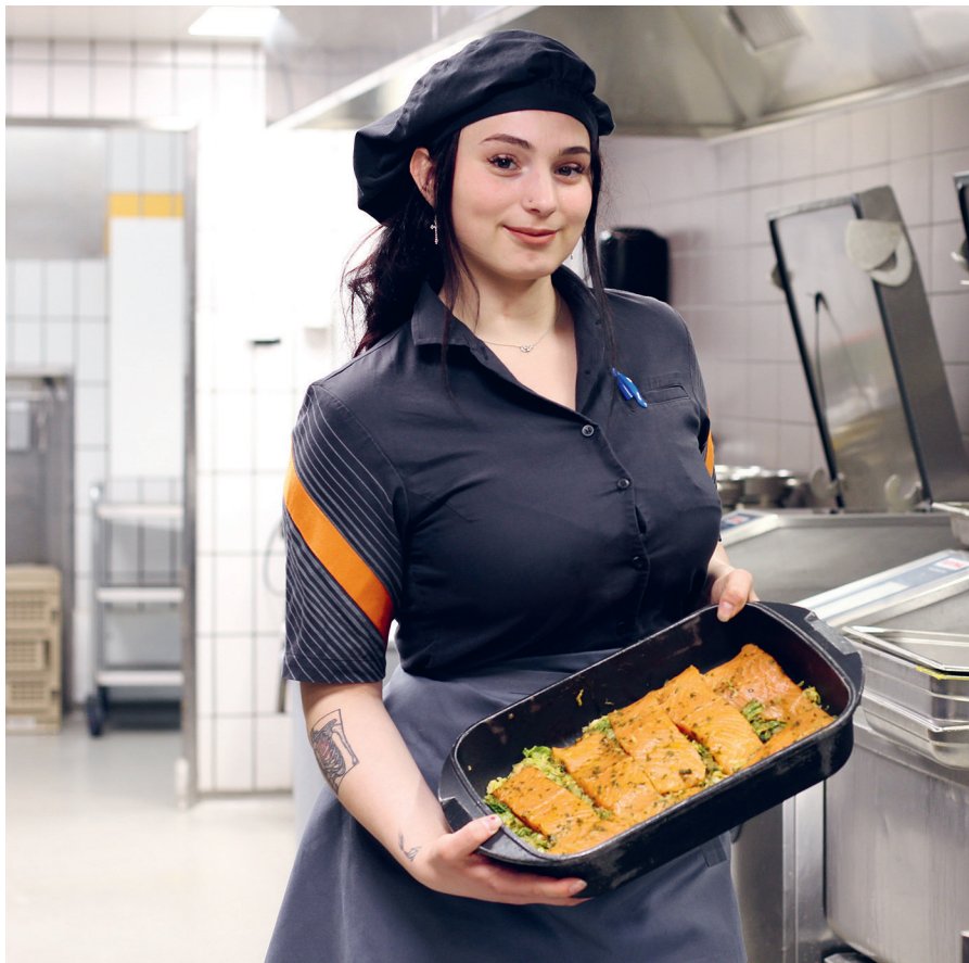
Ein Beruf mit Abwechslung: Die Lernende bereitet in der Küche Speisen fürs Buffet zu.