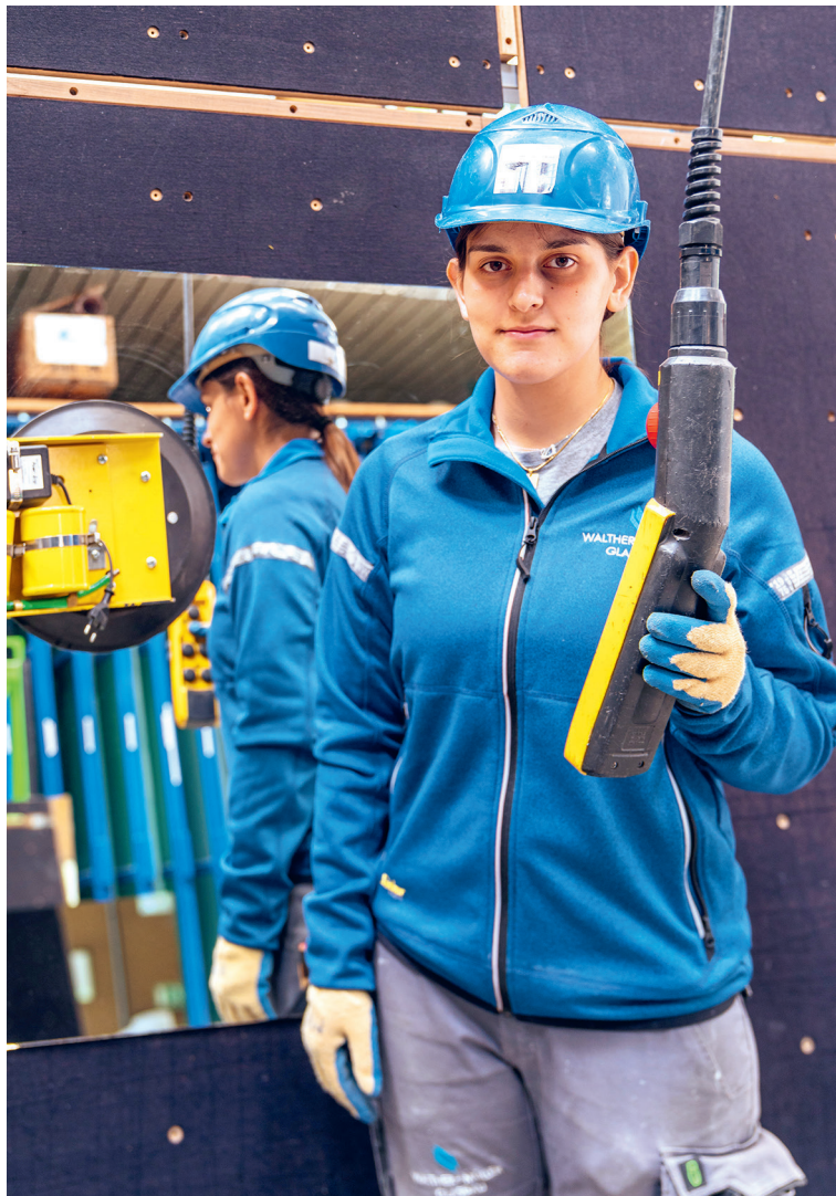
Bilder 3 und 4: Frederic Meyer