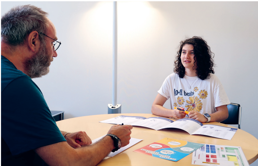
Die Berufsberatung hilft dir, einen passenden Beruf zu finden.