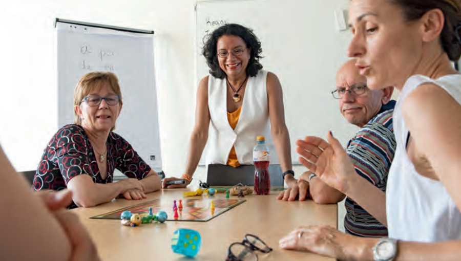
◀ Spielerische Ansätze sind auch bei Erwachsenen sehr beliebt.