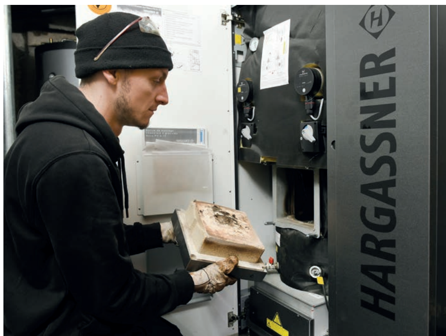
^ Kaminfegerinnen und Kaminfeger arbeiten heute meist an modernen und effizienten Anlagen.