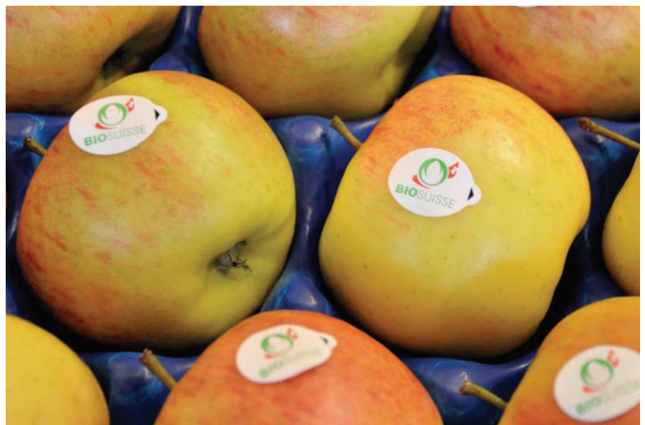
Die Produktion von Lebensmitteln, die mit dem Bio-Label gekennzeichnet werden, profitiert auch von den Erkenntnissen diverser Bereiche der Umweltwissenschaften.

In den letzten Jahren sind im Umweltbereich etliche private Beratungsbüros entstanden, in denen auch Biologen oder Biologinnen mit einem Masterabschluss in Ökologie Arbeit finden. Diese interdisziplinären «Ökoteams» forschen und beraten, entwickeln Konzepte zum Schutz bedrohter Tiere und Pflanzen, erheben Grundlagendaten zu Verbreitung und Bestandesdichten von Arten, erstellen Gutachten zum Beispiel im Bereich Siedlungsplanung, Gewässerschutz und Lufthygiene oder führen Umweltverträglichkeitsprüfungen von neuen Überbauungen durch. Weitere Anstellungen für Ökologinnen und Ökologen finden sich bei Projekten in Entwicklungsländern, bei Verbänden und privaten Stiftungen wie Schweizer Tierschutz, Pro Natura, WWF, Greenpeace usw., im Biologie-Lehramt auf verschiedenen Stufen (nach einer didaktischen Zusatzausbildung), in Museen, im Wissenschaftsjournalismus aber auch in verschiedenen Kaderstellen in allen möglichen Berufszweigen – auch in solchen mit wenig Bezug zur Biologie.