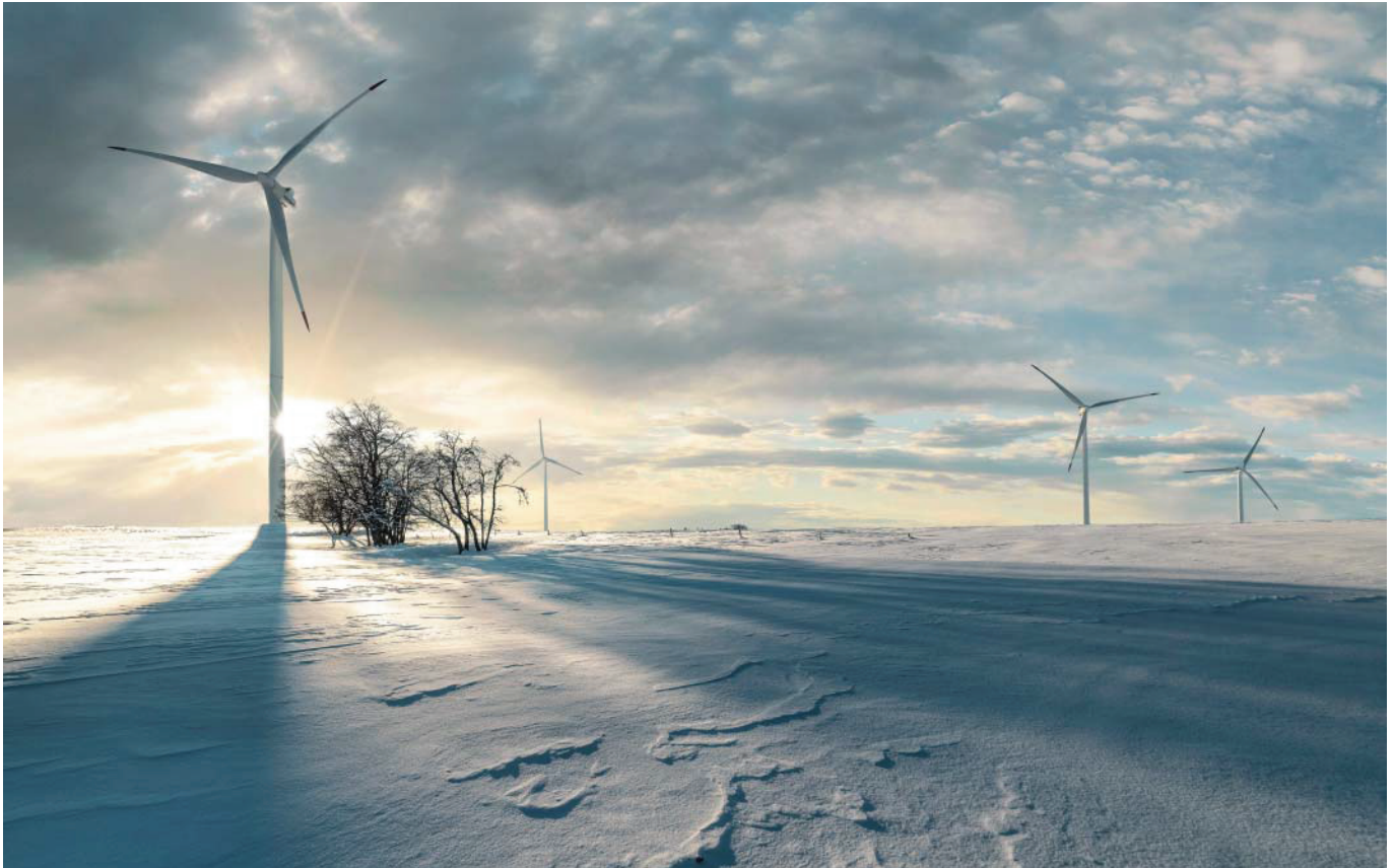
Windkraftanlagen liefern umweltfreundlichen Strom, verändern aber das Landschaftsbild. Bei ihrem Bau sehen sich Umweltingenieurinnen und -techniker deshalb oft mit Widerstand aus der Bevölkerung konfrontiert.